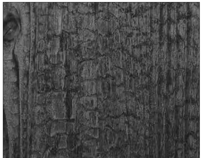
WL Carbonized Wood