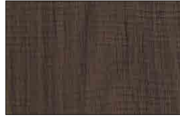
PR WL Nutwood