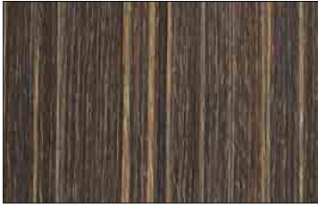
WL Wenge Wood