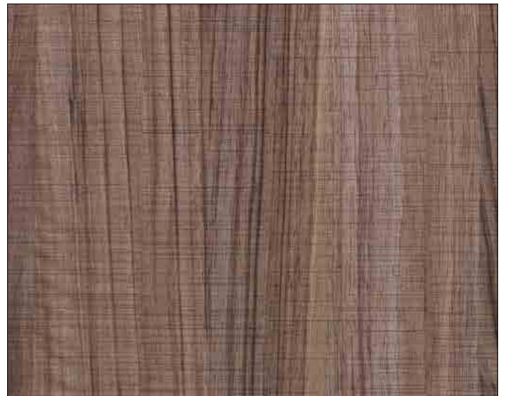
WL Nutwood Country