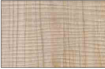
WL Maple Alpine