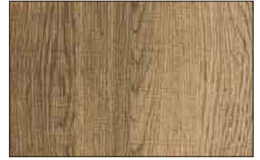
PR WL Sessile OAK