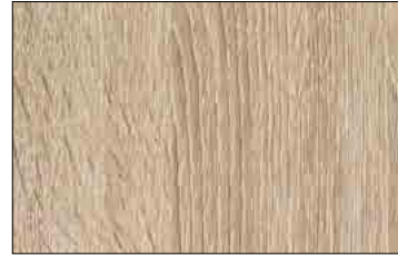
PR WL OAK TREE Light