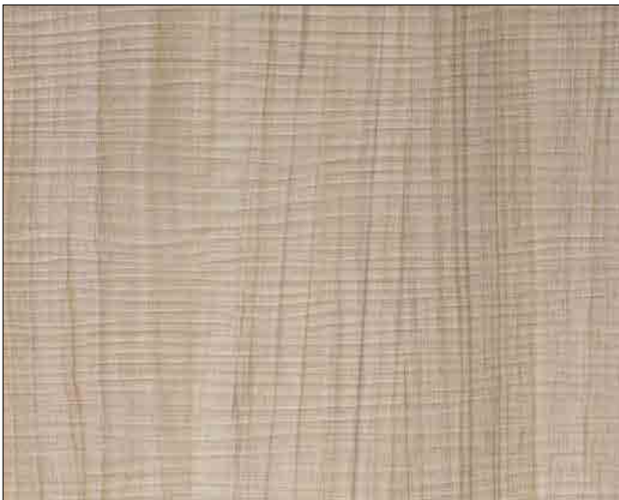
WL Maple Alpine

Not only visually, but also haptically an experience. Innovative manufacturing processes allow a particularly lively wood structure and resource-saving use of raw materials.