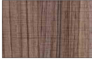
PR WL Nutwood Country