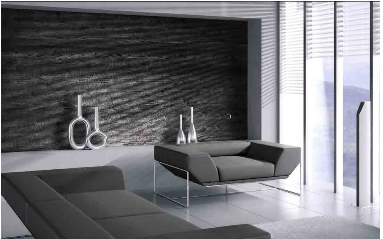
□ WL Carbonized Wood